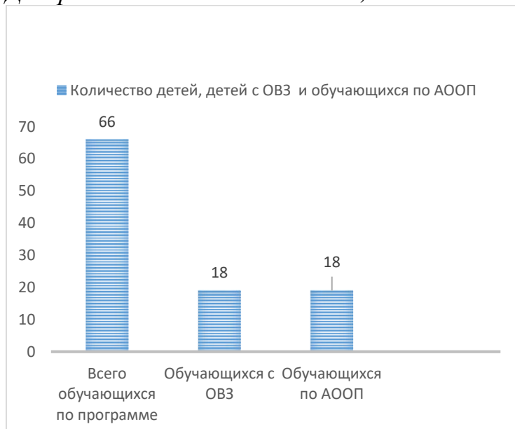
Диаграмма о количестве детей, детей с ОВЗ и обучающихся по АООП