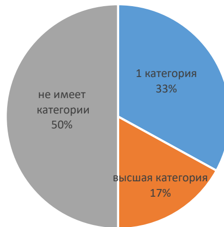
Распределение педагогов МБДОУ д/с №1 по категориям в 2023 г.

■ 1 категория ■ высшая категория ■ не имеет категории ■